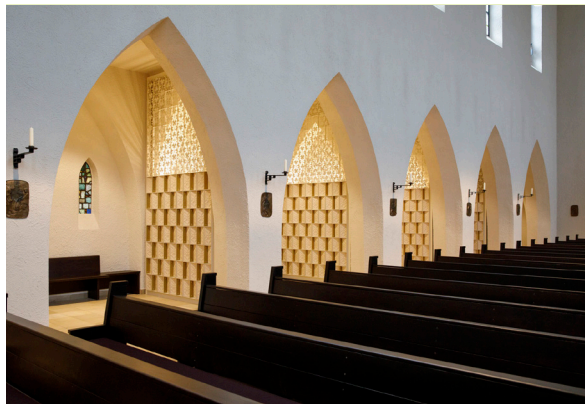
Kolumbarium in Maria Schutz