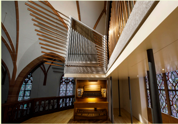
Neue Orgel in der Rochuskirche Hohenecken

Früher als erwartet, wurde der Kirche St. Rochus in Hohenecken eine neue alte Orgel beschert.