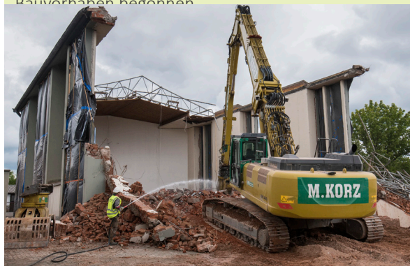
Rückbau der Kirche St. Norbert, 2021