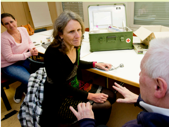
Pflasterstube, Pfarrei Heiliger Martin